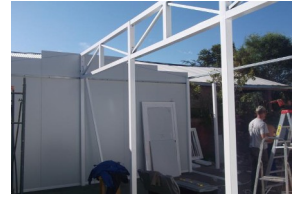
Montaje de estructura