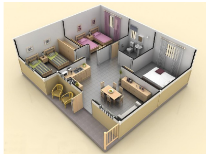
Detalle de distribución en planta de nuestra vivienda de 56 m2