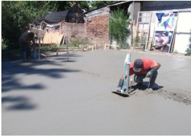
Adecuación de terrenos