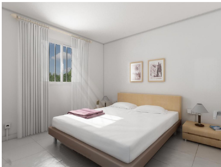
Detalle de dormitorio de acabo interior en blanco