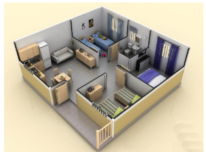
Detalle de distribución en planta de nuestra vivienda de 64 m2