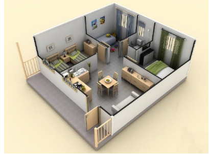
Detalle de distribución en planta de nuestra vivienda de 49 m2